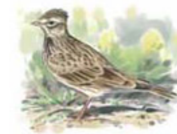
● Alondra común ( Alauda arvensis ) Sky Lark