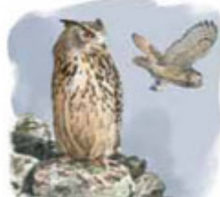
● Búho real ( Bubo bubo ) Eagle Owl