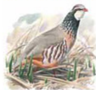
● Perdiz roja ( Alectoris rufa ) Red-legged Partridge