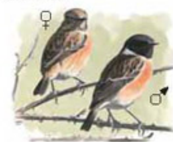
● Tarabilla común ( Saxicola torquatus ) Common Stonechat