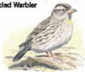
● Gorrión chillón ( Petronia petronia ) Rock Sparrow