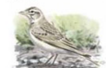
● Terrera común ( Calandrella brachydactyla ) Short-toed Lark