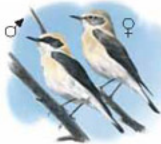
● Collalba rubia ( Denanthe hispanica ) Black-eared Wheatear