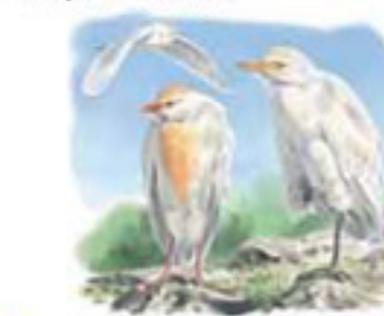
● Garcilla bueyera ( Bubulcus ibis ) Cattle Egret