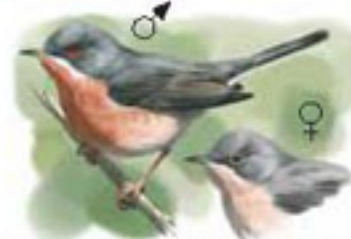
● Curruca carrasqueña ( Sylvia cantillana ) Subalpine Warbler