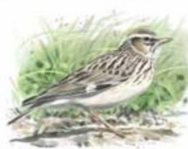
● Alondra totovía ( Lullula arbores ) Wood Lark