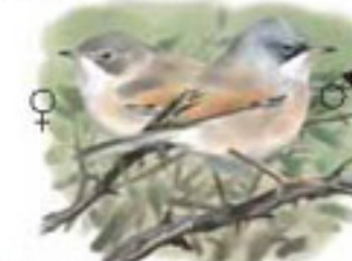
● Curruca tomillera ( Sylvia conspicillata ) Spectacled Warbler