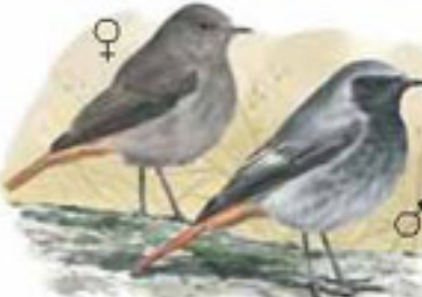
● Colirrojo tizón ( Phoenicurus ochruros ) Black Redstart