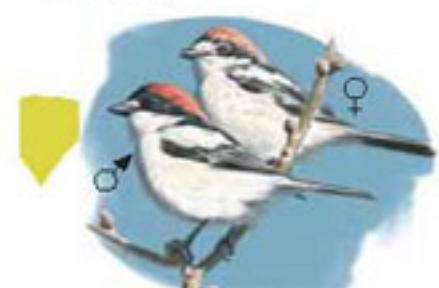
● Alcaudón común ( Lanius senator ) Woodchat Shrike