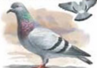
● Paloma bravía ( Columba livia ) Rock Dove