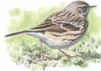
● Bisbita pratense ( Anthus pratensis ) Meadow Pipit