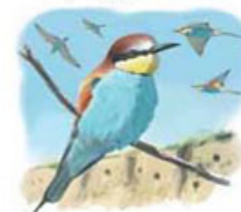
● Abejaruco común ( Merops apiaster ) European Bee-eater