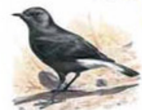
● Jilguero ( Carduelis carduelis ) Goldfinch