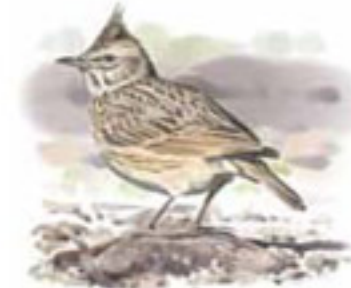
● Cogujada común ( Galerida cristata ) Crested Lark