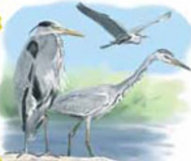
● Garza real ( Ardea cinerea ) Grey Heron