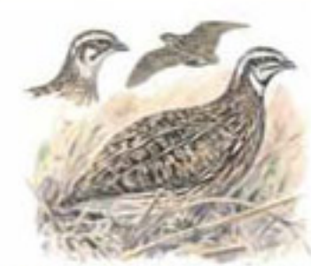
● Codorniz común ( Coturnix coturnix ) Common Quail