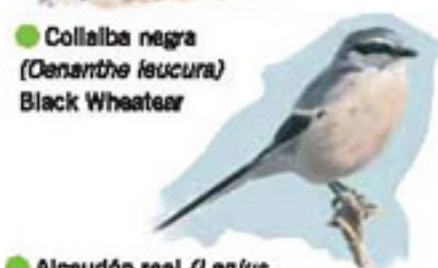
● Alcaudón real ( Lanius meridionalis ) Southern Grey Shrike