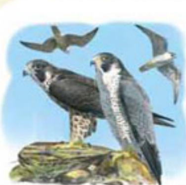
● Halcón peregrino ( Falco peregrinus ) Peregrine Falcon