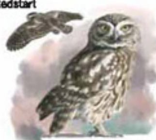
● Mochuelo común ( Athene noctua ) Little Owl