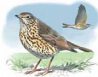
● Zorzal común ( Turdus philomelos ) Song Thrush