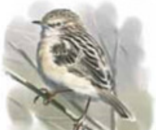
● Buitrón ( Cisticola juncidis ) Zitting Cisticola