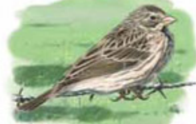
● Triguero ( Emberiza calandra ) Corn Bunting