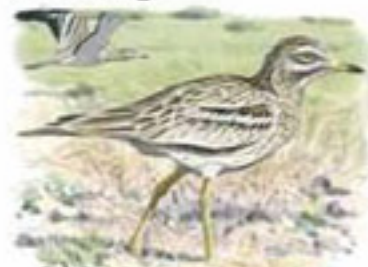
● Alcaraván común ( Burhinus oedicephalus ) Stone-curlew